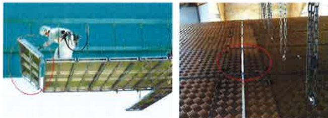
左:ユニットパネルの組み立て、右:開閉床材付近